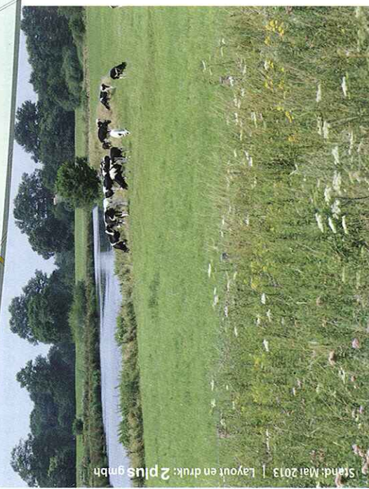
Stand: Mai 2013 | Layout en druk: 2plus gmbh