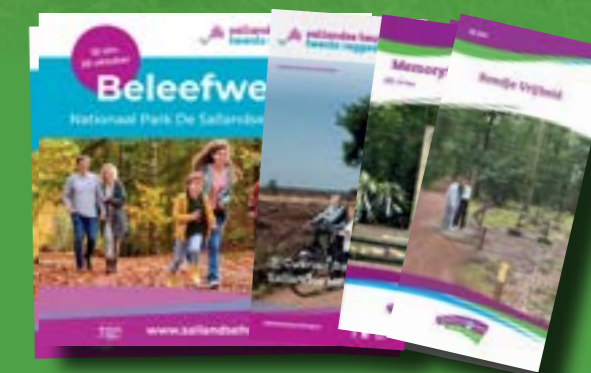
Een greep uit onze uitingen.

De meerjarenovereenkomst 2023-2026 met de gemeente Hellendoorn versterkte deze koers. Door betere promotie van evenementen, professionalisering van toeristische producten en versterkte informatievoorziening off- en online is de zichtbaarheid van Hellendoorn vergroot.