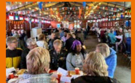
Vrijheidsontbijt en dialooggesprekken

“Deelname aan de dialoogtafels tijdens de viering van 80 jaar vrijheid was voor mij een hele mooie ervaring. Allereerst heb ik mensen ontmoet die ik nog niet kende. Ik kreeg de kans om naar hun verhalen te luisteren. Ook had ik de mogelijkheid om mijn eigen reis naar vrijheid te delen. Wat voor mij het belangrijkste was, is dat de mensen aan tafel met oprechte interesse naar mijn verhaal en gedachten luisterden. Het was geweldig om in een vrije omgeving met vrije mensen over vrijheid te kunnen praten.”