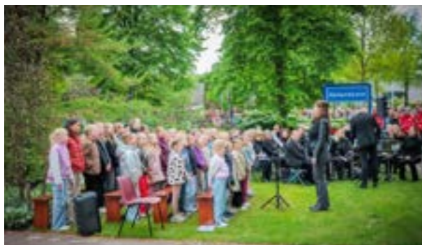
Kinderkoor De Bastiaantjes zong tijdens de 4 mei-herdenking.

80 jaar Vrijheid laat zien dat cultuur meer is dan een activiteit: het is een krachtig middel om mensen te verbinden, verhalen te delen en samen betekenis te geven aan vrijheid.