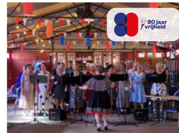
Op 5 mei hebben zes koren gezamenlijk een korenfestival georganiseerd.

Het programma bestond uit onder andere Camp Nijverdal, dialoogtafels, educatieve projecten, exposities, muzikale evenementen en herdenkings- en feestmomenten, waaronder een groot defilé van oude voertuigen, re-enactors en kinderen met versierde fietsen op 3 mei. De vrije toegankelijkheid trok een breder publiek (sociaal, cultureel en economisch) en bracht groepen samen die elkaar normaal minder snel ontmoeten.