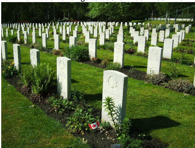
Foto: Canadese begraafplaats

De Canadese Begraafplaats in Holten is een plek voor bezinning. Hier worden slachtoffers van de Tweede Wereldoorlog herdacht. Achter elk van deze 1394 graven schuilt een indrukwekkend verhaal. Tijdens uw bezoek, in het naastgelegen informatiecentrum, krijgt u meer inzicht over de inrichting van het ereveld en komt u meer te weten over de gesneuvelde militairen. Aan de hand van persoonlijke verhalen anekdotes en foto's, vaak door nabestaanden geschonken, wordt de gedachte aan hen die vielen levend gehouden. Belangrijk onderdeel van het informatiecentrum is de filmzaal, waar u een impressie kunt zien van de bevrijding van Oost-Nederland door de Canadezen en de totstandkoming van het ereveld. Het centrum is voor iedereen gratis toegankelijk en biedt een bron van informatie 'for all generations'. Voor meer informatie zie: www.canadesebegravingholten.nl