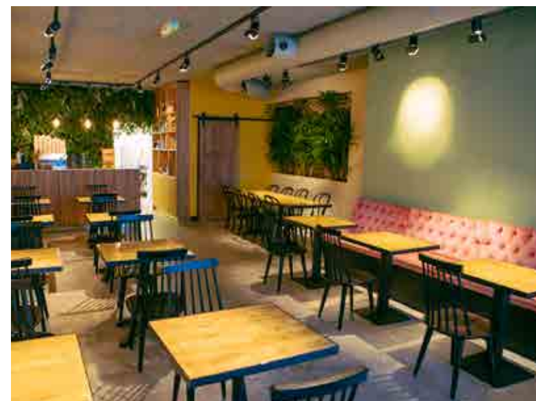
Zaken met één product in de hoofdrol zijn in opkomst, zoals The Avocado Show in Amsterdam.