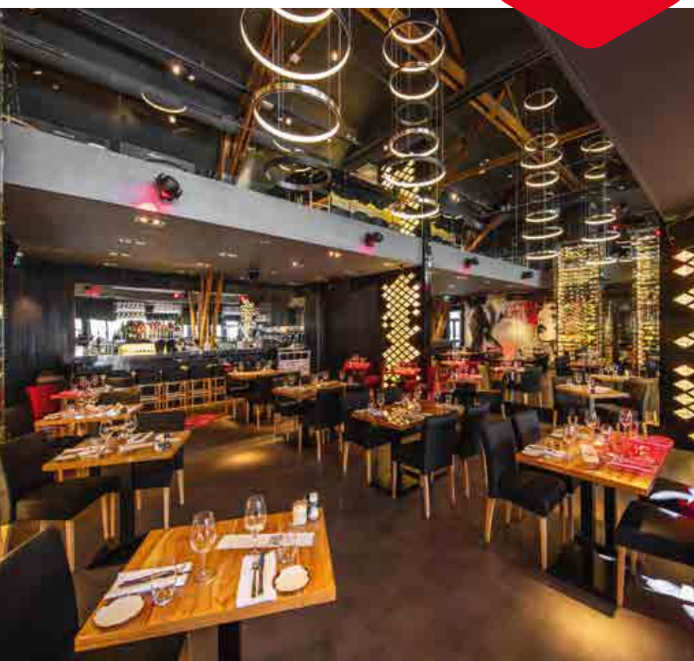
Een goed lichtplan is essentieel voor het neerzetten van een goed concept. Licht en geluid bij het onlangs geopende Encore by Simonis zijn gedaan door DEP.