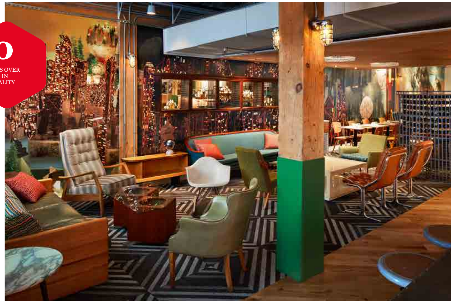
Eclectische stijl is de trend, zoals het interieur bij het in juni geopende Drake Commissary in Toronto. Het interieur is een combinatie van vintage en modern.