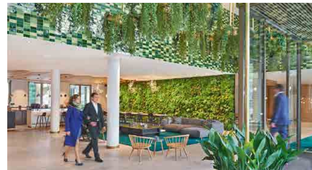
De eerste indruk geeft aan wat gasten kunnen verwachten. Bij het in april geopende Hyatt Regency Hotel in Amsterdam lopen lobby en receptie naadloos over in restaurant Mama Makan. Het design weerspiegelt de natuurlijke omgeving van het hotel.

Toiletten zijn heel belangrijk in een concept. Glintmeijer: 'Een verzorgd toilet is een must. Beginnen met je diner en net vooraf de informatie delen dat de toiletten vreselijk en