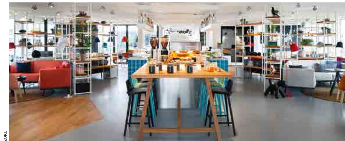
Er is meer integratie van businessmodellen: in Zoku Amsterdam slapen en werken gasten.