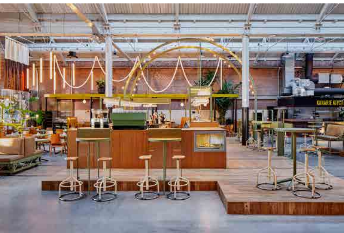
'We kunnen nog even vooruit met de mooi ontworpen, trendy en informeel chique industriële zaken. Er is nog geen volgende grote designtrend op komst.'

het algemeen atmosferisch ontwerp. Cosmo design is werelds en een tikkeltje upscale. Hiermee bedoel ik niet noodzakelijk super de luxe en over the top, maar goed ontworpen, bijvoorbeeld The Lobby Fizeastraat in Amsterdam. Modern ethnisch design heeft invloeden van buitenlandse keukens, zoals het design bij de Amsterdamse zaken Happyhappyjoyjoy en Izakaya. Bij atmosferisch ontwerp wordt gelet op de sfeer met focus op verlichting, gelaagdheid (meer diepten in de zaak en materialen creëren), topmaterialen en diepe kleuren. Het 'snelle werk' en de goedkope oplossingen, waarvan de europallet een mooi voorbeeld is, gaan denk ik voorbij.'