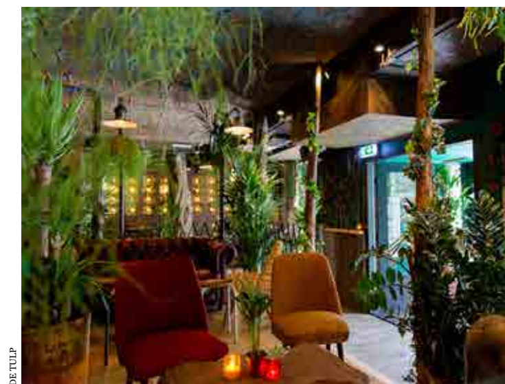
Steeds meer verwijzingen naar de natuur met grote planten en natuurlijke materialen en kleuren.