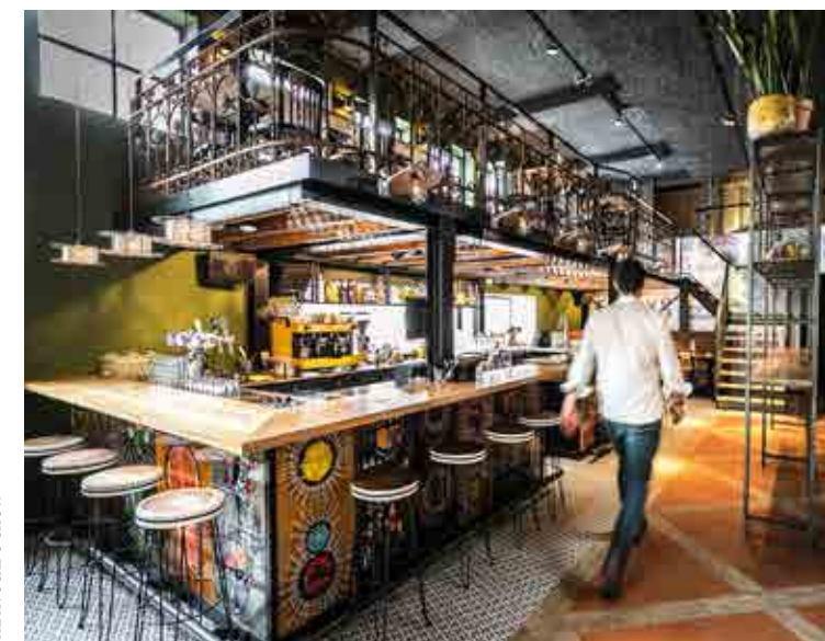
In opkomst: modern etnisch design met invloeden van buitenlandse reukens. Mooi voorbeeld is Escobar in Amsterdam.