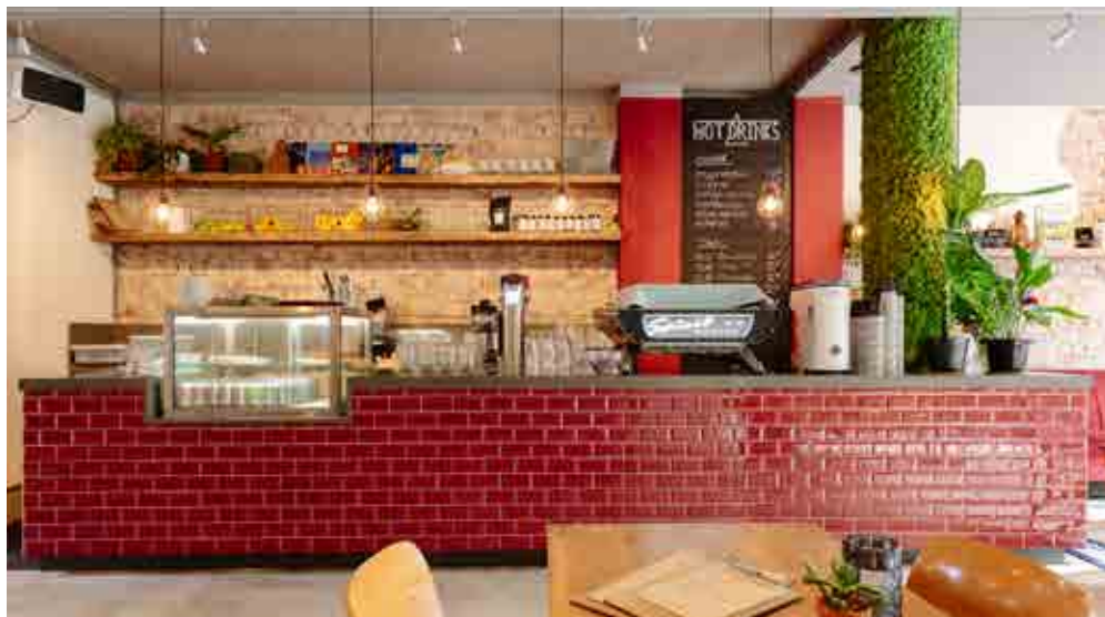
BEELD: KARIN VERHOOG / DESIGN: LIANNE BONGERS

Gasten zijn steeds bewuster bezig met eten, ontspanning en beweging. De nieuwe zaak Bhalu in Nijmegen speelt hier op in door koffie, gezond eten én yoga te combineren. Uitgangspunt voor het interieur is 'in balans komen met jezelf'. Dit uit zich in duurzame, natuurlijke en levende materialen.