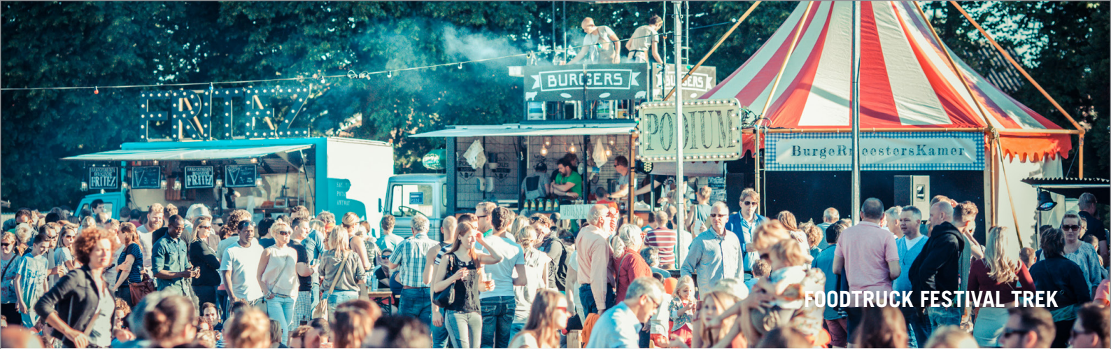
FOODTRUCK FESTIVAL TREK