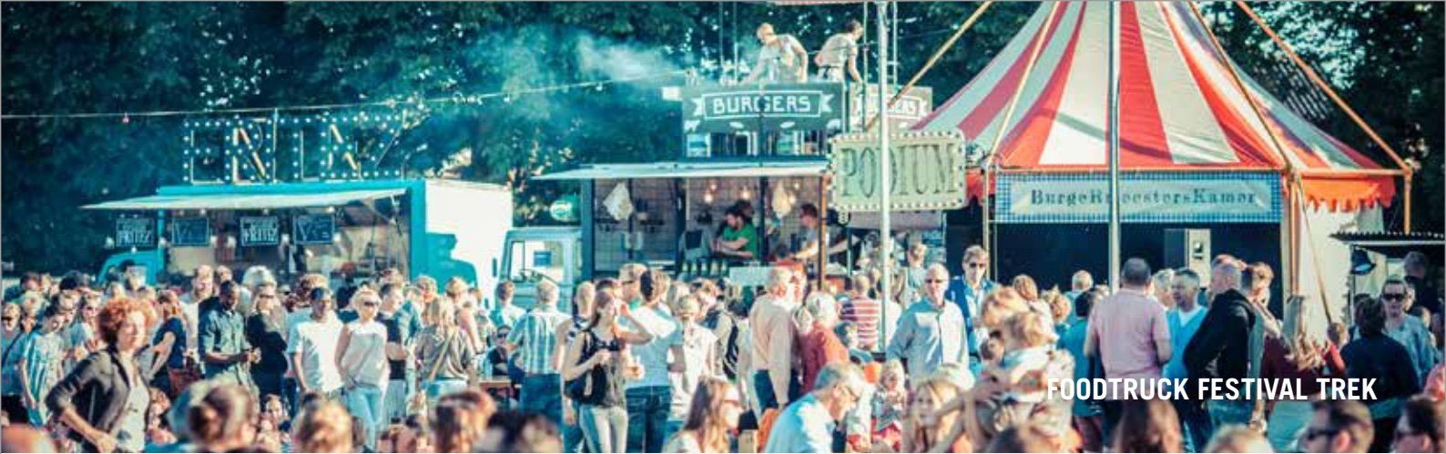
FOODTRUCK FESTIVAL TREK