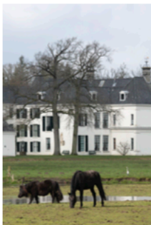
De Trambaanwandelroute voert onder meer over een oude spoorbrug. Op de achtergrond de Tankenberg (82 meter). Foto boven: landgoed Singraven bij Denekamp.

“ DE OUDE RAILS EN BIELZEN KREGEN EEN NIEUW BESTAAN BIJ STALINGRAD