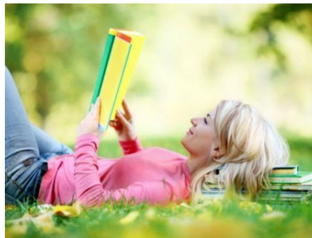
Scholing personeel omtrent online Marketing