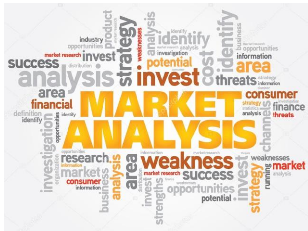
Marktanalyse voor nieuwe diensten/producten