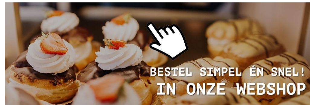
Een webshop ontwikkelen voor uw verblijfsrecreatieve bedrijf.