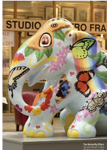
The Butterfly Effect By Jane Sherris, Canton 16. November 2009