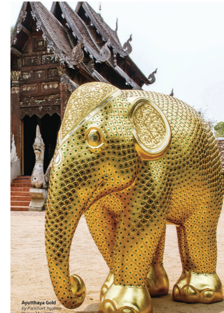
Ayutthaya Gold By Parichart Suwan 16. November 2009