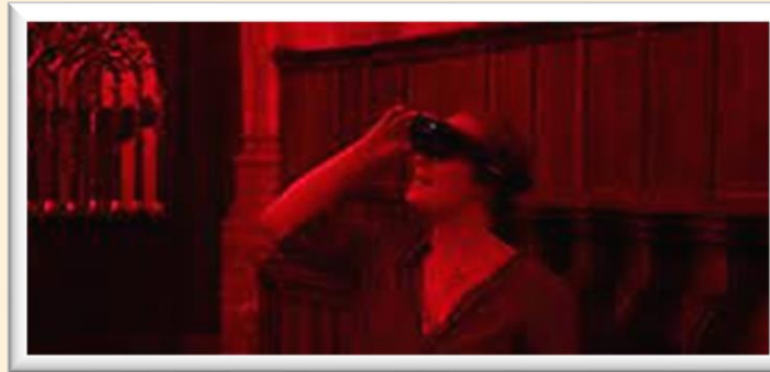
HoloLens in de Grote Kerk Amsterdam