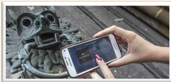
England Historic Cities app