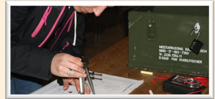
Bunker Escaperoom IJmuiden