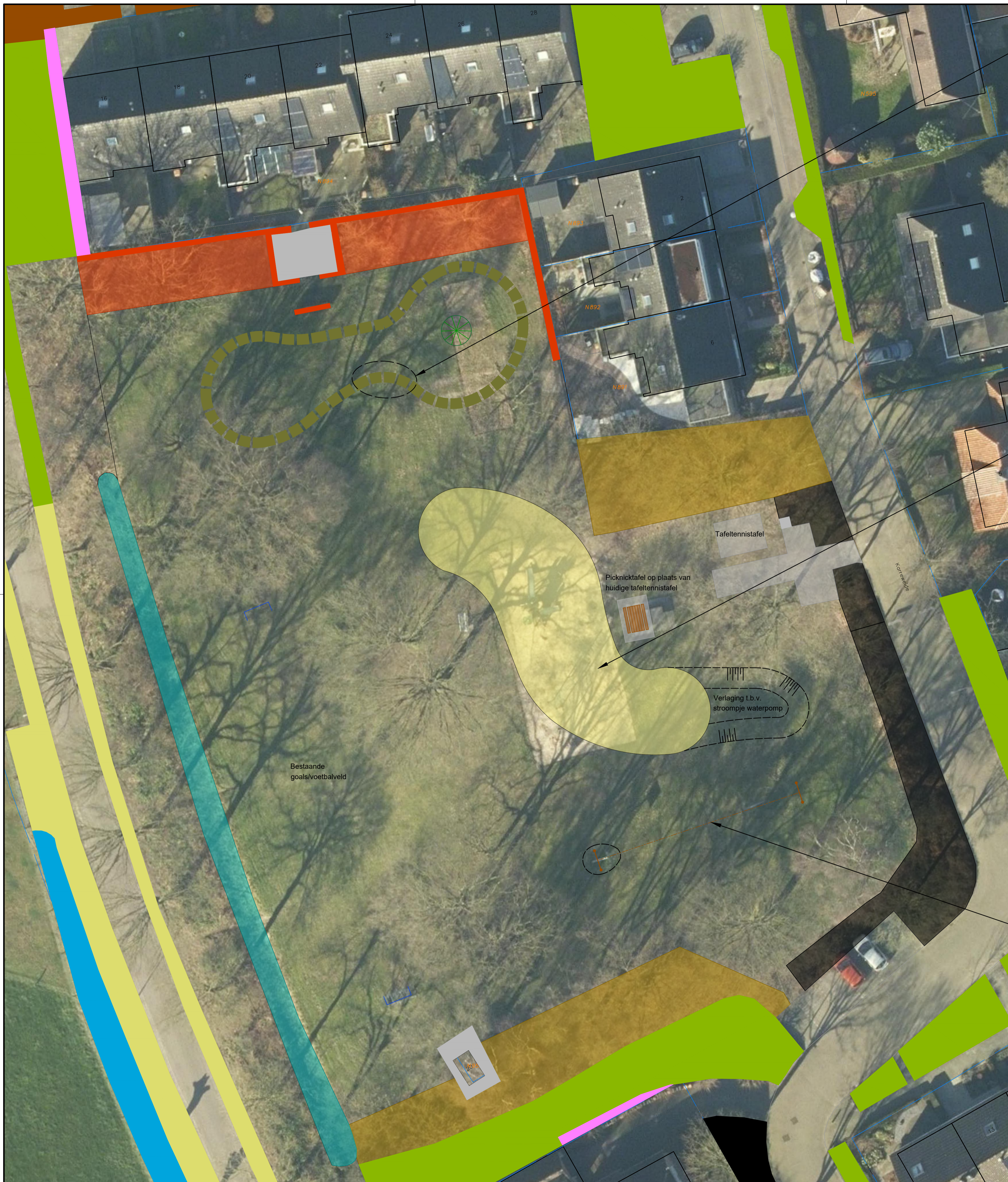
'Natuurlijk' spelen; fietscrossbaan met hoogverschillen, speelheuvel + speelbuis, wilgentippie en natuurlijke speelboomstam;