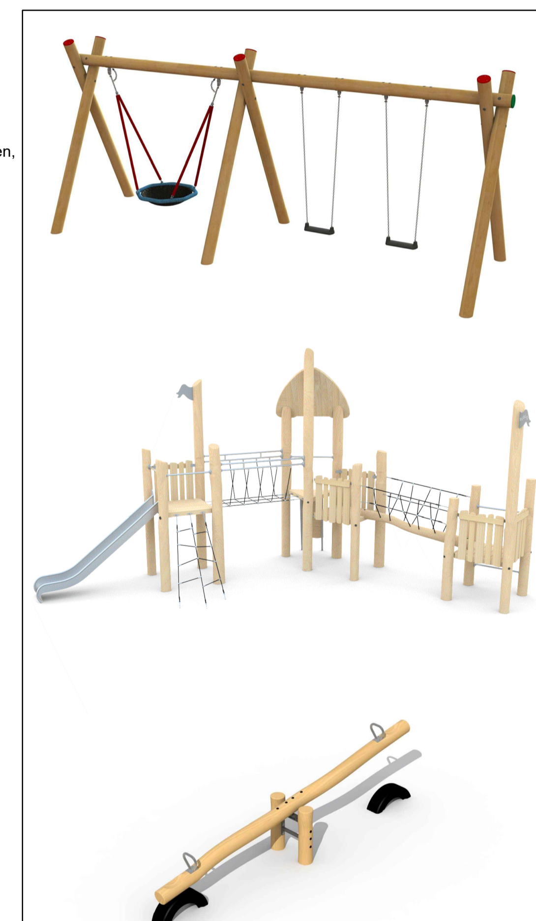
Alle hoogte maten t.o.v. NAP(meters) en lengtematen in meters tenzij anders is aangegeven. Maatvoering onder voorbehoud.