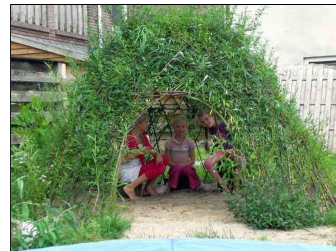
Aanpassen speelzand in organische vorm speelzand met mogelijke speelelementen, soorten en posties n.t.b.;