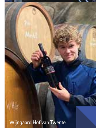
Wijngaard Hof van Twente