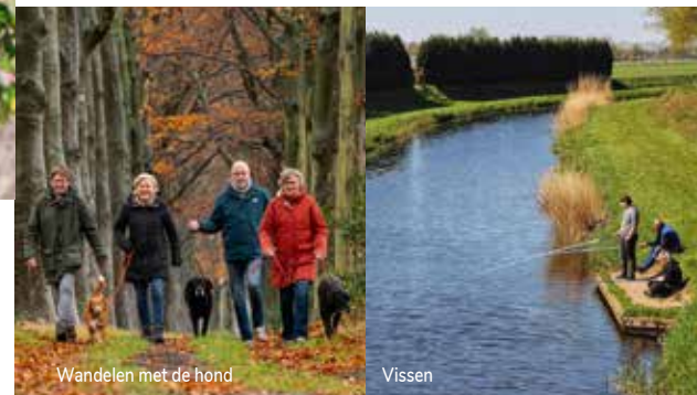
Wandelen met de hond

PAARDRIJNETWERK TWENTE | Vanaf een paardenrug ziet de wereld er opeens anders uit. De maneges in de Hof heten je van harte welkom om te komen paardrijden. Een buitenrit stel je eenvoudig samen met behulp van het Paardrijnetwerk Twente. Er is altijd wel een startpunt in de buurt. Wil je langer blijven en zoek je een veilige overnachtingsplek voor jouw paard? In de Hof is voldoende pensionstalling. Meer info: visithofvantwente.nl/paardrijden