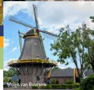
Molen van Buursink