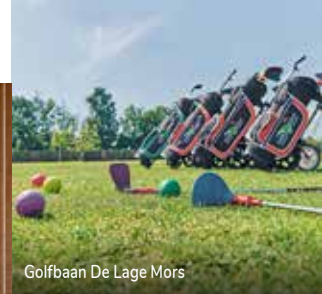
Golfbaan De Lage Mors