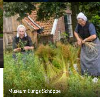
Museum Eungs Schöppe

goastok en het strooien van sierlijke zandfiguren. Bij mooi weer kun je de ambachten buiten op het plein voor het museum bewonderen. Kijk op visithofvantwente.nl voor de exacte data.