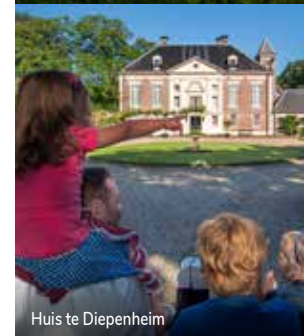
Huis te Diepenheim