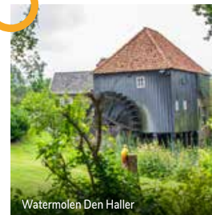
Watermolen Den Haller

Verwen je neus in Rosarium de Broenshof, slenter langs de Regge en door de vlindertuin. Breng een bezoek aan Cultuurcentrum Herberg de Pol met binnen- én buitentheater. Even verderop vind je een oude stadsbleek die in ere hersteld is. Dit is een historische plek waar vroeger gewassen, gedroogd en gebleekt werd. De route die al deze mooie plekjes en tuinen verbindt is verkrijgbaar bij de VVV. Ga je liever met een gids op pad?