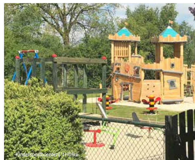
Kinderspeelboerderij 't Höfke

Wat dacht je ervan om de Hof eens stapvoets te bekijken? Vanaf de rug van een paard of pony ziet alles er anders uit. Of ga eens op stap door het buitengebied van Markelo met een alpaca of ezel. Leuk voor het hele gezin! Kijk voor adressen op visithofvantwente.nl of op pagina 42 van deze uitgave. Tip: Combineer deze uitjes met een gezellige picknick onderweg.