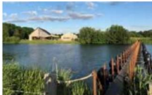
Infocentrum IJssel Den Nul

Infocentrum IJssel Den Nul, gelegen langs de IJssel aan de rand van het natuurontwikkelingsgebied de Duursche Waarden, is met een goede informatieve presentatie over het omringende landschap, parkeer-gelegenheid, horeca en het naastgelegen natuurswembad een ideaal startpunt voor het ontdekken van dit gebied.