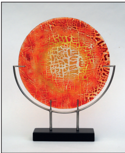
Alies van der Poll

Deze expositie is te zien van 20 september t/m 11 oktober