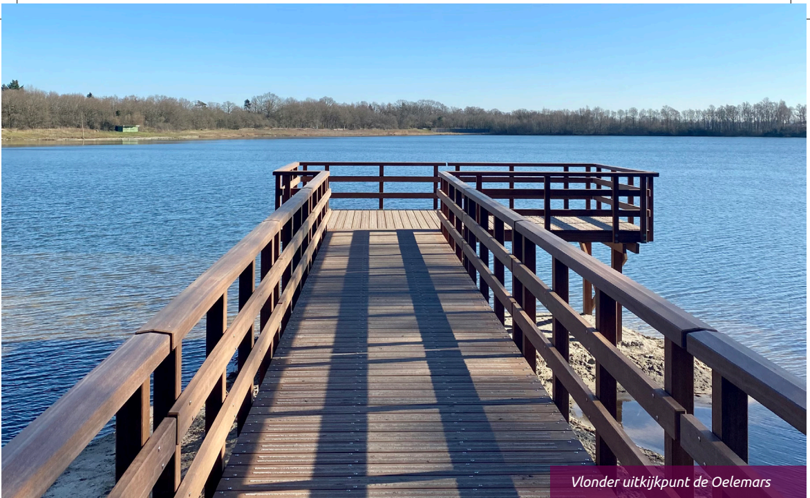
Vlonder uitkijkpunt de Oelemars