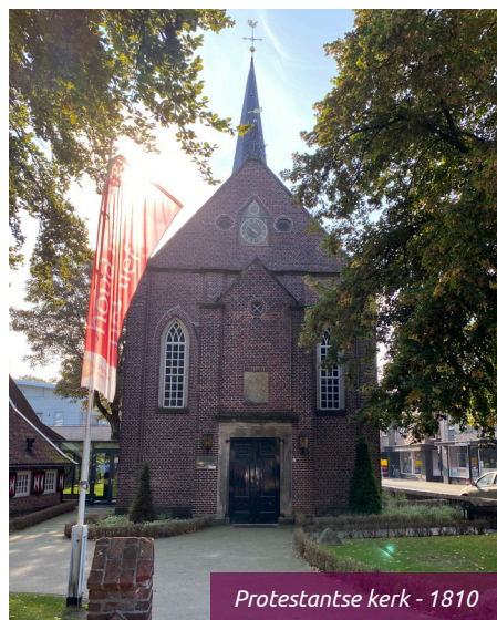
Protestantse kerk - 1810

In 2010 zijn de kerk en het naastgelegen Aleida Leurinkhuis (zie punt 21) grondig verbouwd, waarbij beide gebouwen door middel van een glazen corridor met elkaar werden verbonden. Hierdoor ontstond een modern kerkelijk centrum.