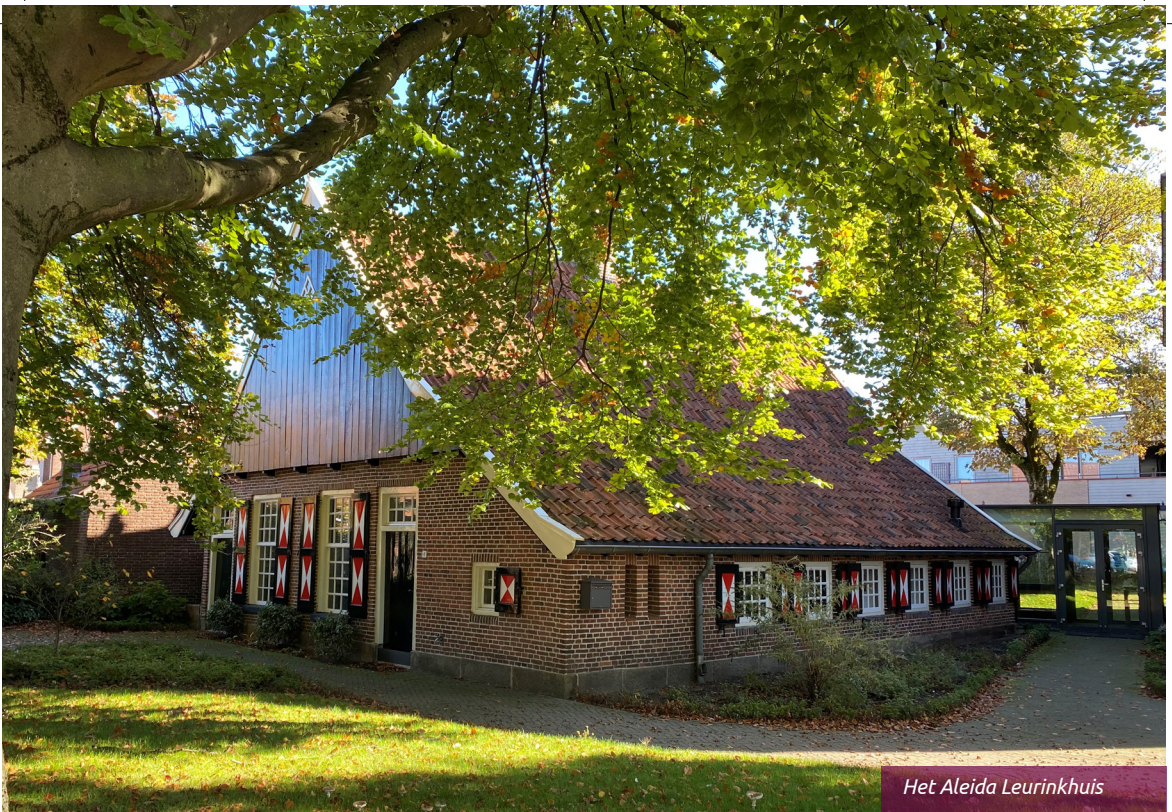
Het Aleida Leurinkhuis