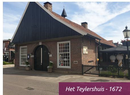
Het Teylershuis - 1672

Een langgerekt huis met een zadeldak en aan de achterkant een zaal met eronder een kelder. Het huis werd in de 17e eeuw in opdracht van Derk Froen gebouwd. In 1718 door de familie Teylers betrokken en in 1778 door hen aan de straatzijde uitgebreid. Het bouwjaar (1672) wordt aangegeven op de sluitsteen van de inrijpoort, die verder de inscriptie draagt "Christus solus est servator mundi" (Christus alleen is de Redder der wereld).