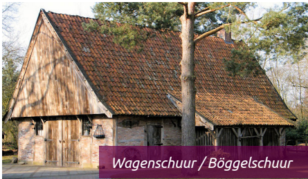
Wagenschuur / Böggelschuur

De kosten van de herbouw van de boerderij bedroegen ruim 1,5 miljoen gulden. Als eerste object kwam het Wönnelhoes met berging gereed, gevolgd door de wagenschuur, de hoofdboerderij, de bakspieker, de iemenschouer, de geitenstal (ook in Saksische stijl) en de tuffelkelder. Zoals eerder vermeld hebben de Böggelrieders hier hun onderkomen in de Böggelschuur en een heuse smederij.