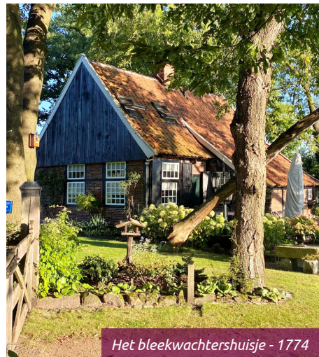
Het bleekwachtershuisje - 1774

Het bleekwachtershuisje is gebouwd in 1774, in hetzelfde jaar dat de Bleek is aangelegd.