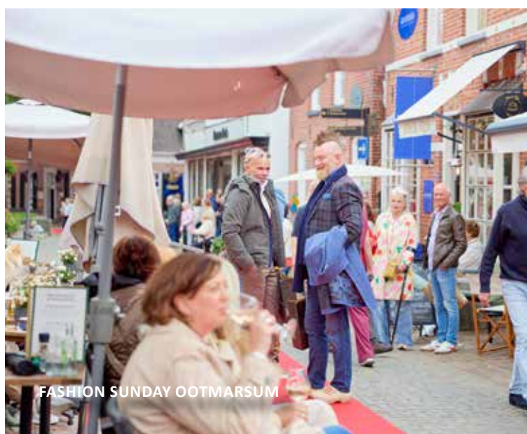
FASHION SUNDAY OOTMARSUM