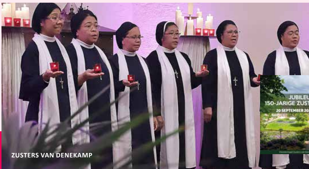
ZUSTERS VAN DENEKAMP

Op zaterdag 20 september vonden twee bijzondere concerten plaats in de kloosterkapel. Het eerste concert was snel uitverkocht, waarna werd besloten een tweede concert in te plannen. In totaal genoten bijna 450 bezoekers van deze unieke avond waarin Oost en West samenkwamen met zang, muziek en dans.