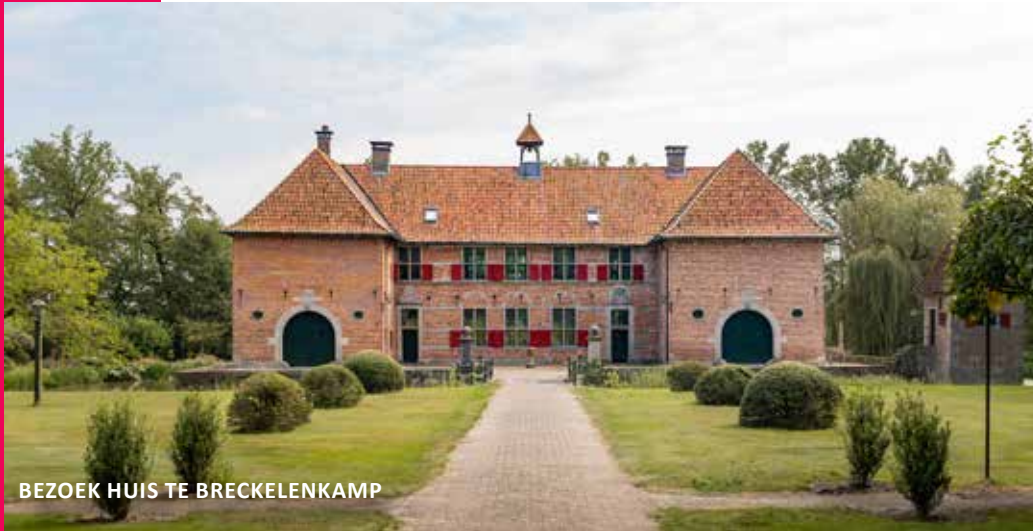
BEZOEK HUIS TE BRECKELENKAMP

De promotie en ticketverkoop verliepen via de kanalen van Visit Ootmarsum-Dinkelland. De rondleidingen vonden plaats op 21 juni, 19 juli en 16 augustus en trokken in totaal 72 enthousiaste deelnemers.