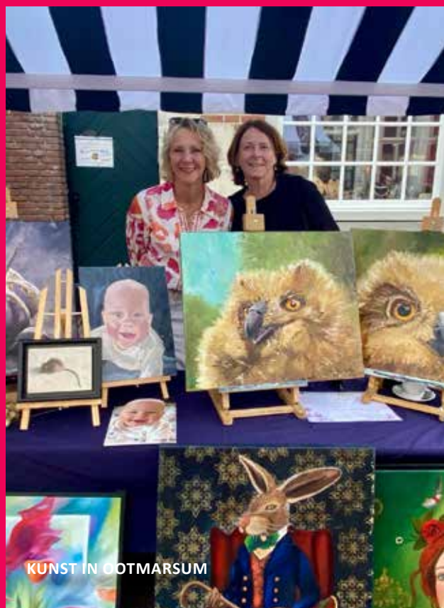
KUNST IN OOTMARSUM