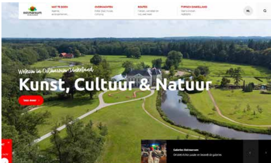
Nieuw template website www.visitootmarsum-dinkelland.nl